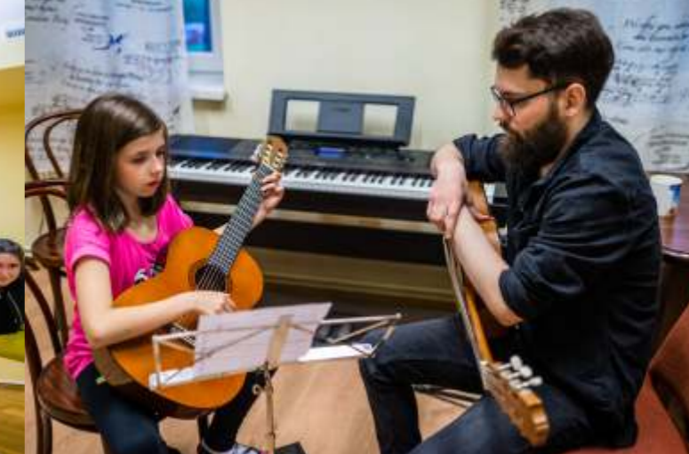
DLA DZIECI, MŁODZIEŻY I DOROSŁYCH

Zajęcia raz w tygodniu po 90 min. Cena: 80 zł/miesiąc