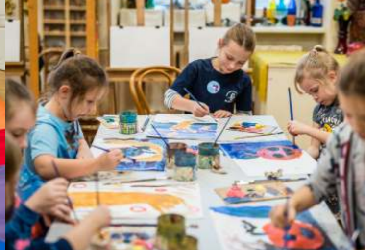
DLA DZIECI I MŁODZIEŻY

Zajęcia raz w tygodniu po 30 min. Cena: 32 zł/miesiąc