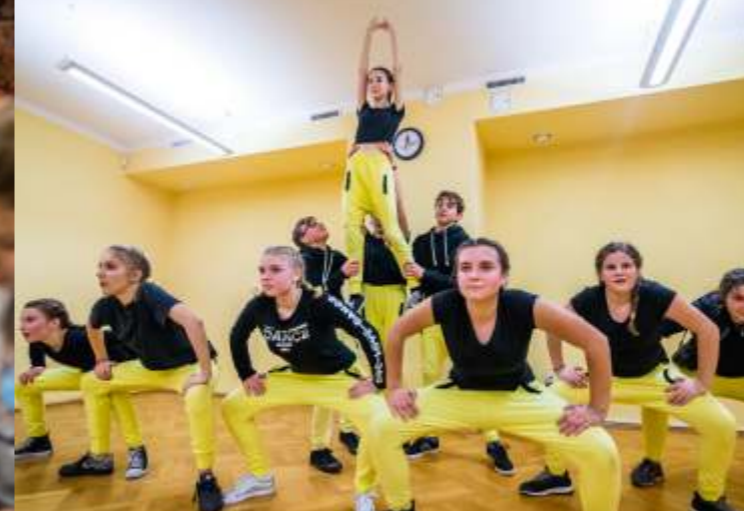
DLA DZIECI I MŁODZIEŻY

Zajęcia raz w tygodniu po 60 min. Cena: 60 zł/miesiąc